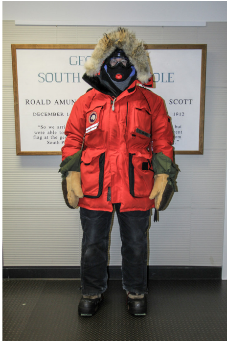
Was man bei -80 Grad Celsius so trägt...