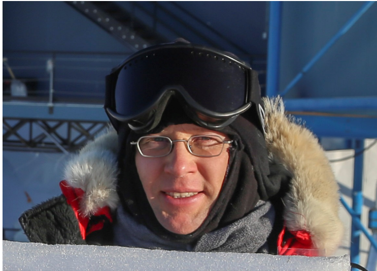
Robert Schwarz © Robert Schwarz