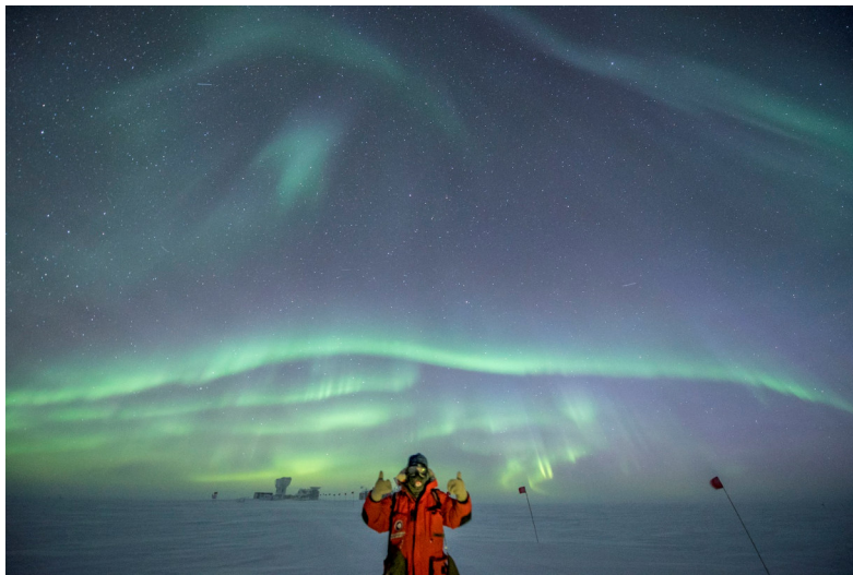
Polarlichter über der Amundsen-Scott Station

Pressekontakt: Gemeinde Vaterstetten Presse- & Öffentlichkeitsarbeit Wendelsteinstraße 7, 85591 Vaterstetten